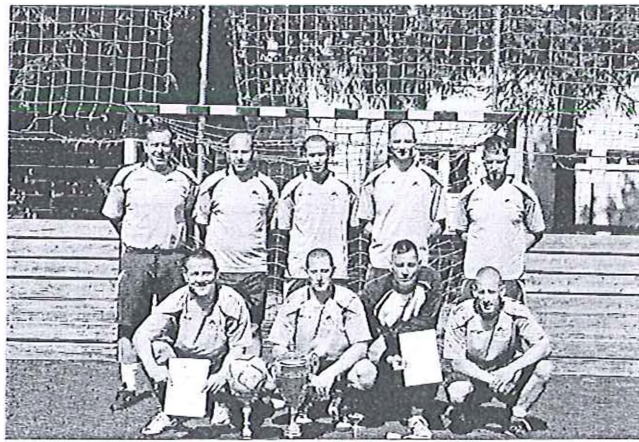
A XXV. Flórián kupa I. helyezett csapata 2016.04.22. Encs

A személyi állomány kiképzésének, továbbképzésének színvonala, minősége az értékelt időszakban megfelelt a szakmai elvárásoknak.